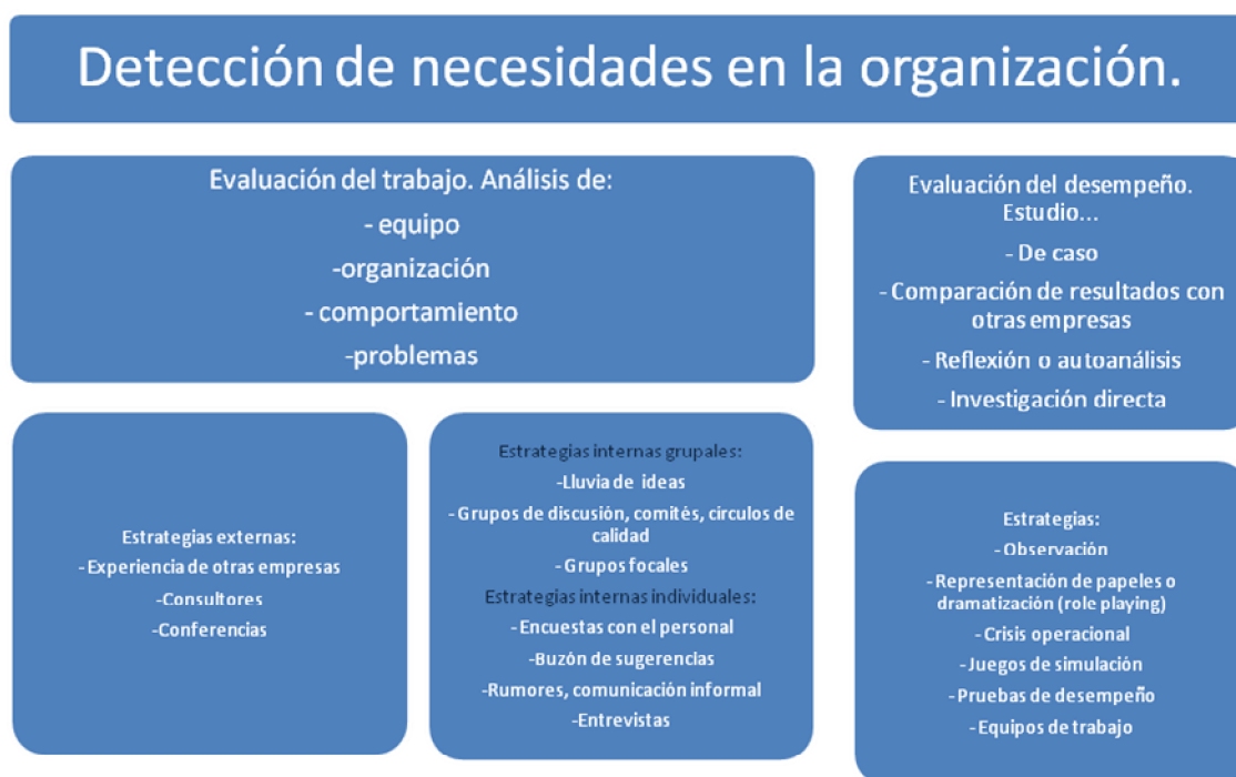
Cuadro 5.9 Detección de necesidades en la organización

El siguiente esquema sirve para orientar las decisiones respecto a qué herramientas utilizar para llevar a cabo la detección de necesidades.